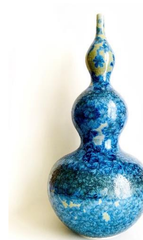
La Boisselière – Objets de décoration Koh Sato - Céramique SCHRECK FRERES et Elie Weissbeck - Ebénisterie