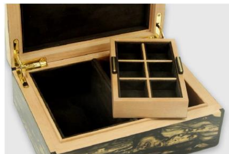
Pauline André - Objets de décoration en cuir Litavis - Globes Flo Home Design - Création textile Walter Bellini - Objets de décoration SCHRECK FRERES - Ebénisterie Okamoto Yuriko - Verre et Cristal